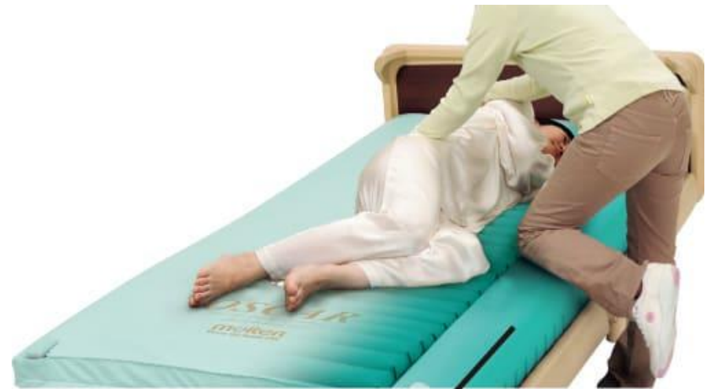
安定支持フォーム