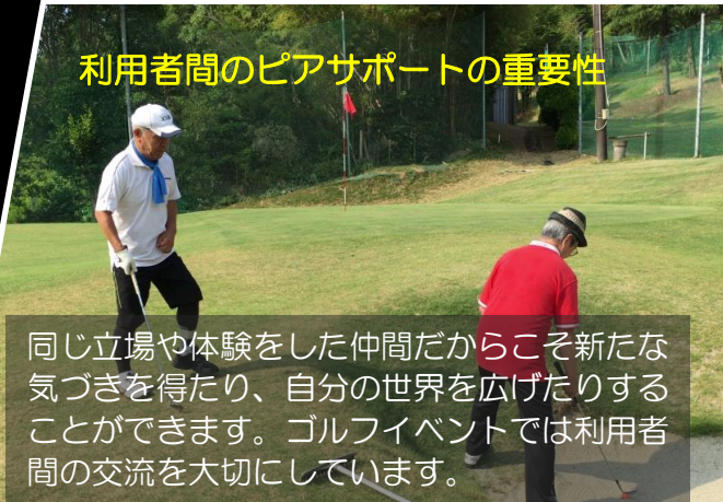
同じ立場や体験をした仲間だからこそ新たな気づきを得たり、自分の世界を広げたりすることができます。ゴルフイベントでは利用者間の交流を大切にしています。