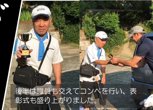
後半は職員も交えてコンペを行い、表彰式も盛り上がりました。