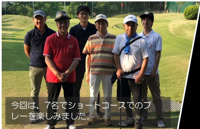
今回は、7名でショートコースでのプレーを楽しみました。