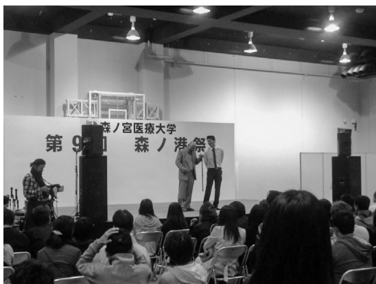
[写真3] 学園祭での「失語症漫才」

平成27年8月より、当社は「Cafe Ordinary」をオープンした。これも、「その人が生きる場所を私たちが創り出す」という考えの基に実行したチャレンジの一つである。積極的な障害者雇用を