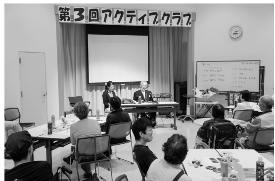
[写真2] 障害体験の発表