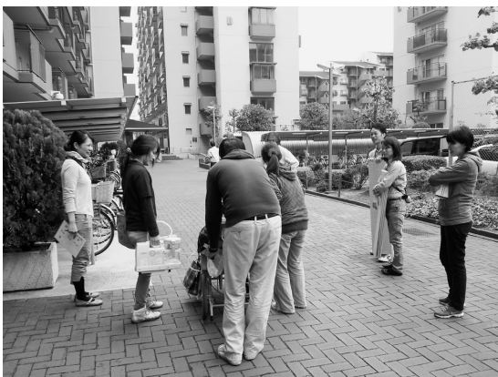
[写真1] 難病患者の外出支援